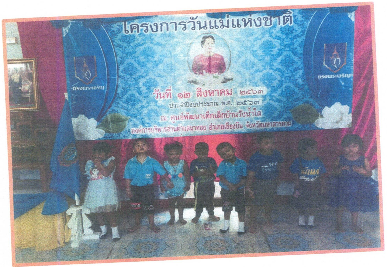
โชว์การแสดงวันแม่