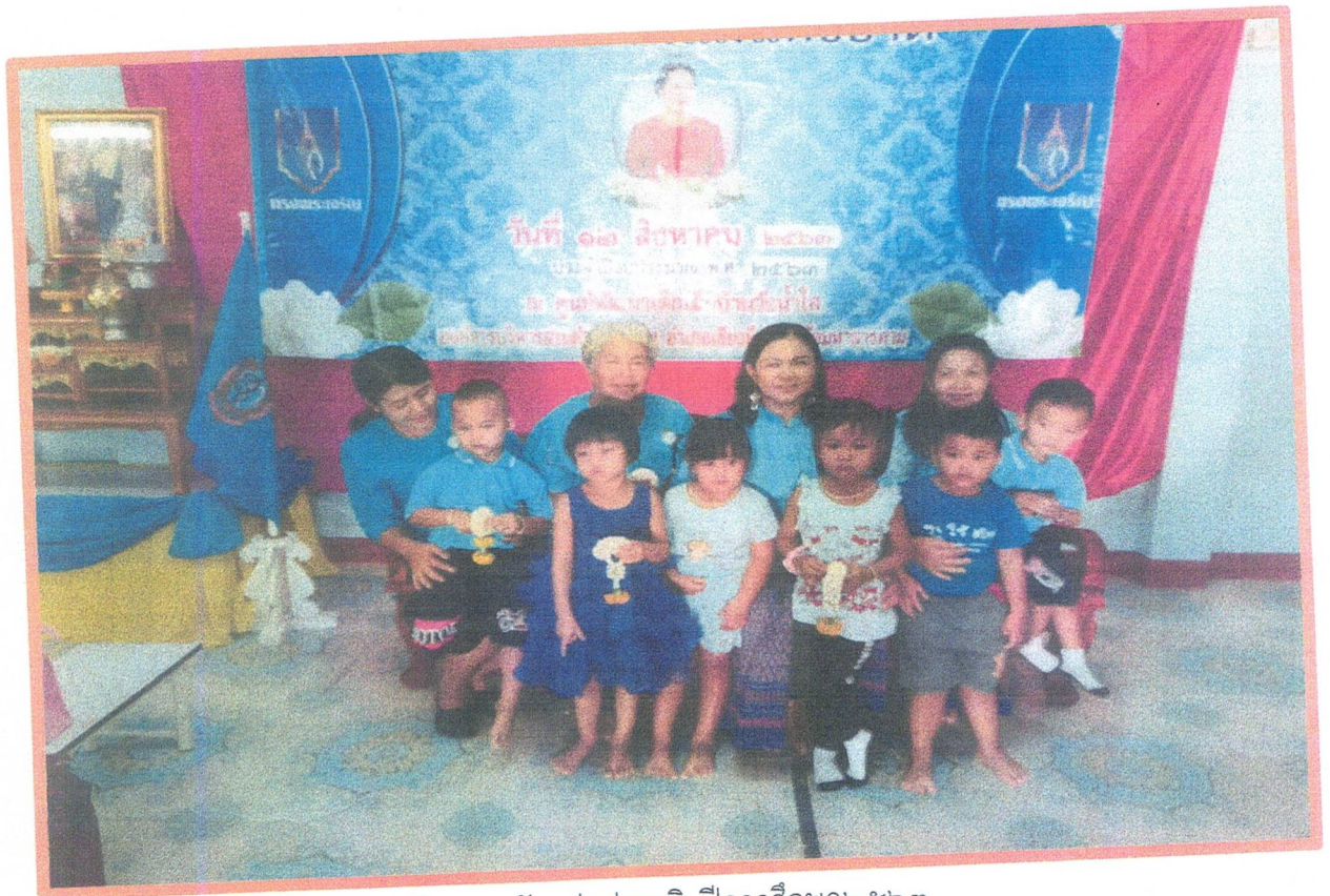
กิจกรรมวันแม่แห่งชาติ ปีการศึกษา๒๕๖๓