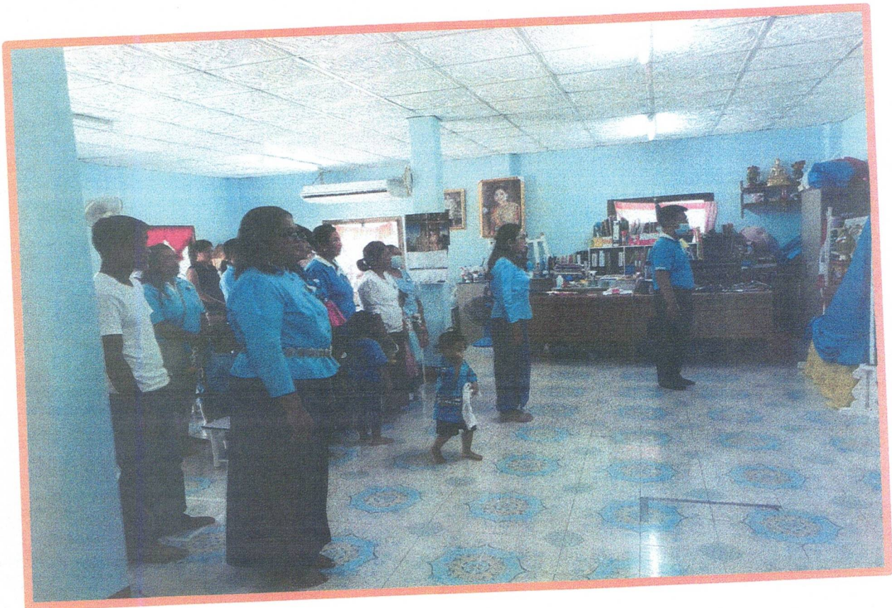
กิจกรรมวันแม่แห่งชาติ ปีการศึกษา๒๕๖๓