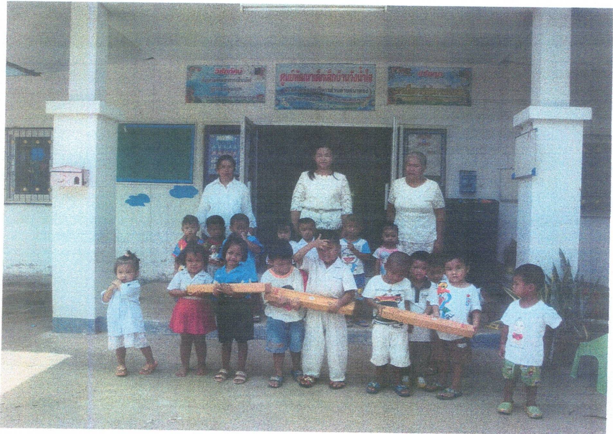
นักวิชาการศึกษา / คณะครูและเด็กๆ ร่วมกันรับพรอิมบุญกันถ้วนหน้า