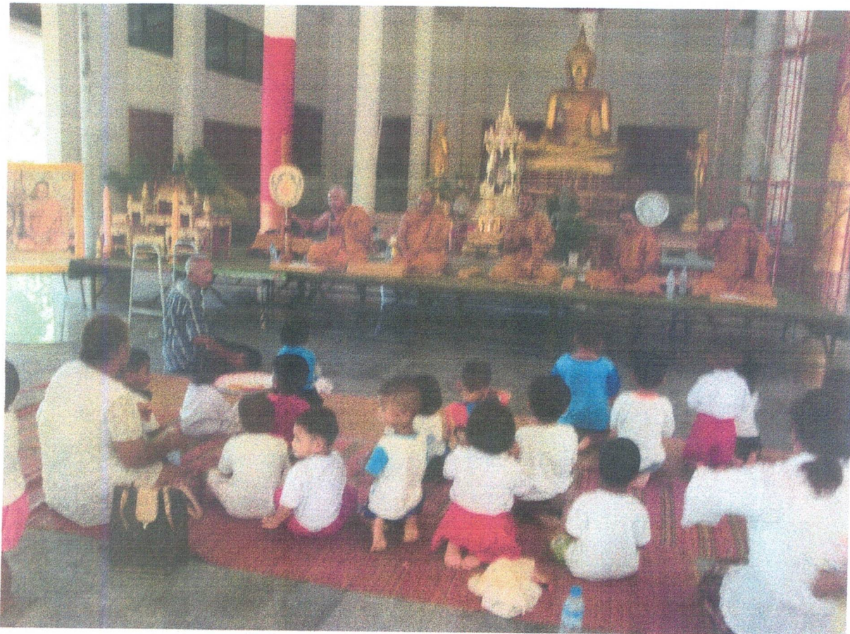
นักวิชาการศึกษา / คณะครูและเด็ก ๆ ร่วมกันรับพรอิมบุญกันถ้วนหน้า